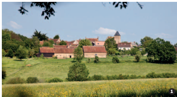
Village de Saint-Jean-des-Échelles ❶