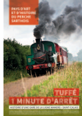
Affiche © Canoté Darre

→ Accès libre et gratuit en partenariat avec l'association des Amis de l'Abbaye de Tuffé.