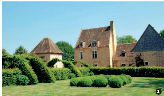
Jardin du manoir de Buis à Saint-Célerin ①